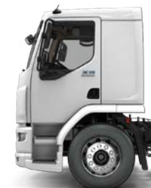
Extended Day Cab