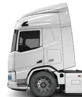
Sleeper High Cab